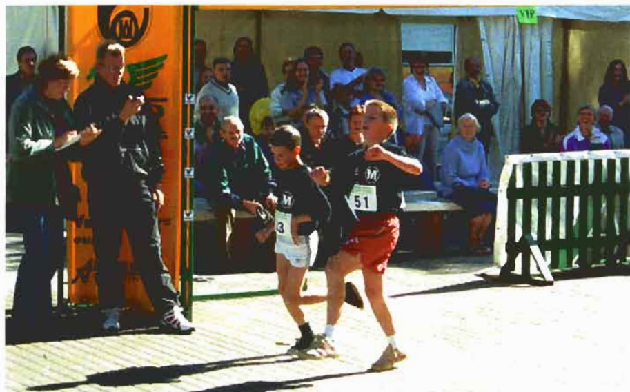
Jauniausi varžybų "Druskininkai 2003" dalyviai