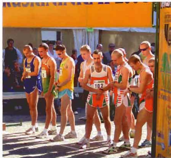
Vyrai ruošiasi startui.